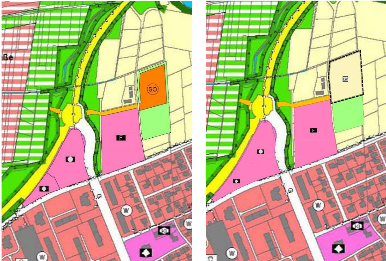
Links: Ausschnitt aus dem Flächennutzungsplan (Bestand), unmaßstäblich Rechts: Ausschnitt aus der Flächennutzungsplan-Teiländerung, unmaßstäblich