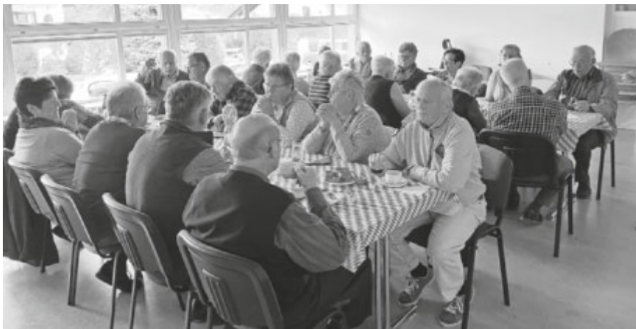
Seniorentreff am 03.10.2024