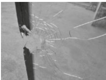
Ein Geschoss durchschlug die Scheibe der Schlepperkabine und verletzte zwei Insassen.

Rechtzeitige Planung und die Ansprache des Jagdleiters vor Beginn inklusive Sicherheitsbelehrung und Schilderung des Jagdablaufes sind mitentscheidend für eine sichere und erfolgreiche Jagd. Die Broschüre „Erntejagd“ der SVLFG wurde überarbeitet. Zusätzlich gibt es ein Merkblatt und die Hinweise zur Ansprache des Jagdleiters bei der Erntejagd unter www.svlfg.de/jagd .